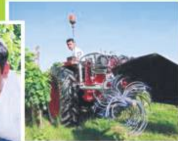
CHAQUE TÊTE comporte cinquante-deux fils. Ils sont régulièrement renouvelés, ceux de l'arrière toutes les deux heures et à l'avant toutes les quatre heures. La bobine de 120 mètres coûte dix euros.